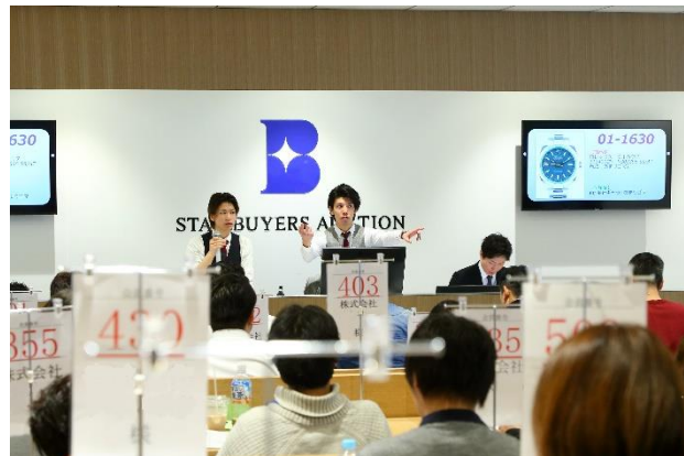
（東京本社オークション会場と自社事業「STAR BUYERS AUCTION」の様子）