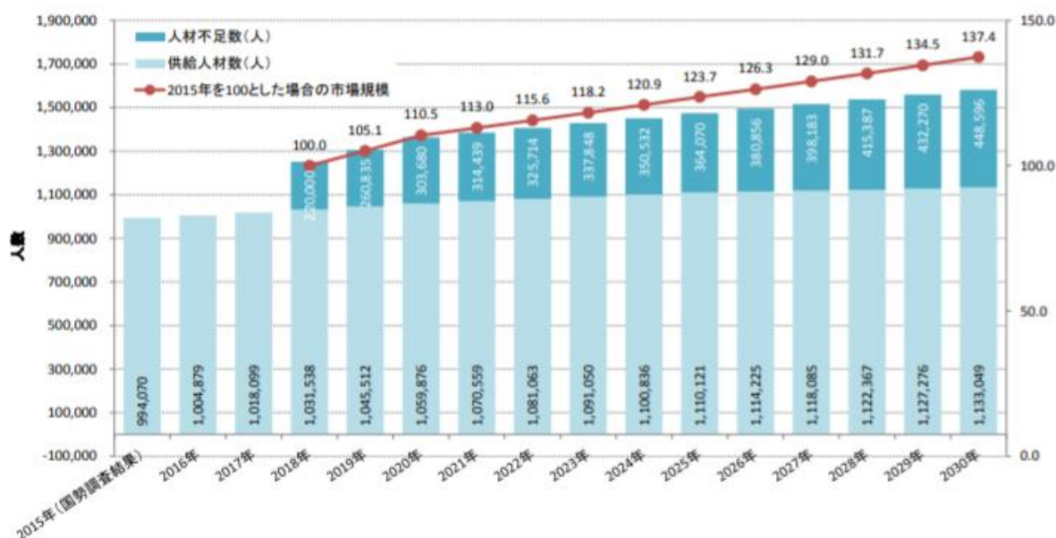
図 3-9 IT 人材需給に関する主な試算結果② (生産性上昇率 0.7%、IT 需要の伸び「中位」)

(参照：経済産業省 IT 人材需給に関する調査 https://www.meti.go.jp/policy/it_policy/jinzai/houkokusyo.pdf )