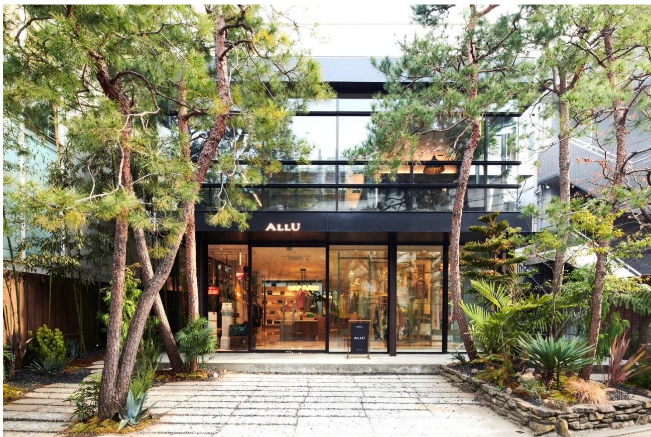
表参道店3階の特別フロアにて高山都さんのリユースイベント『ALLU CLOSET』を 4月29日（金・祝）より5月14日（土）まで開催

4月22日（金）アースデイより、ALLU表参道店から世界へ。 モノの価値を未来に繋ぐための情報発信や、 サステナブルを体験するリユースイベントがスタート。